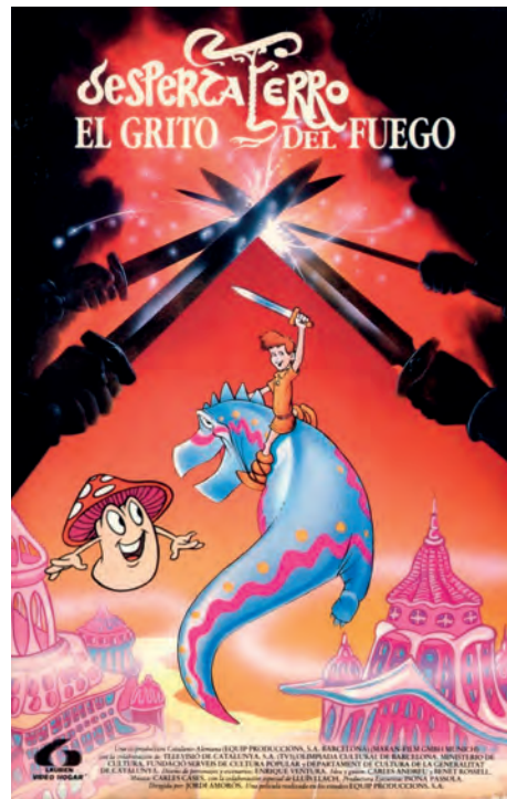
Fig. 4. Portada de la edición en VHS de Despertaferro , de Lauren Films Video Hogar.