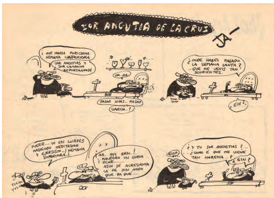
Fig. 2. Fragmento de la historieta Sor Angustias de la Cruz , realizada por JA. Publicada en la revista El Papis , nº 203, 8 de abril de 1978, p. 19.