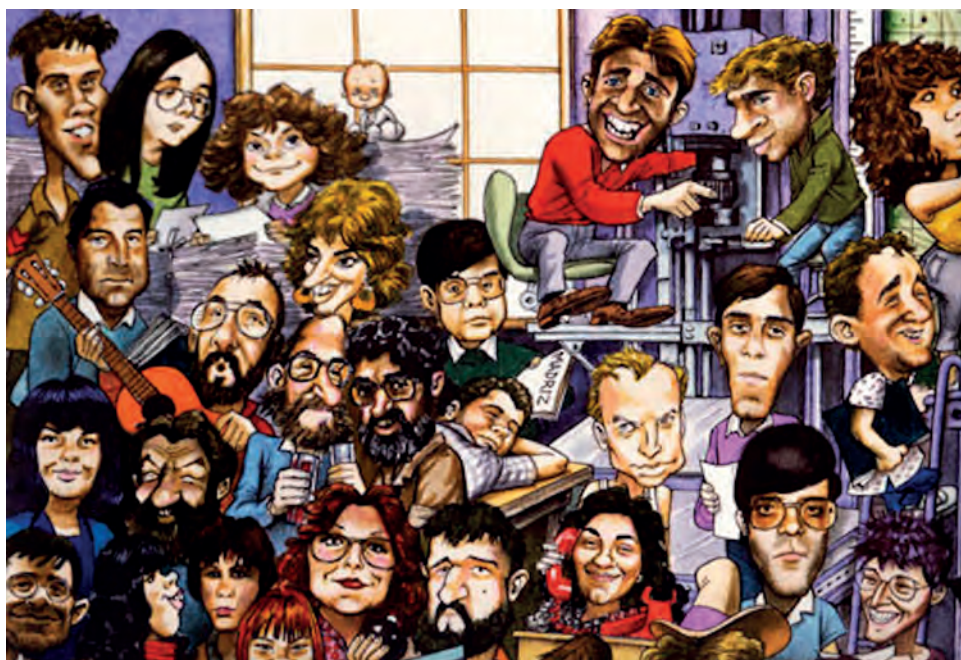
Fig. 7. Caricatura de parte de los componentes de EQUIP, realizada por Enrique Ventura.